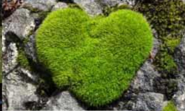
Herzförmiger Moospolster am Biwakplatz