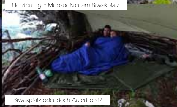
Biwakplatz oder doch Adlerhorst?