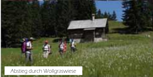
Abstieg durch Wollgraswiese