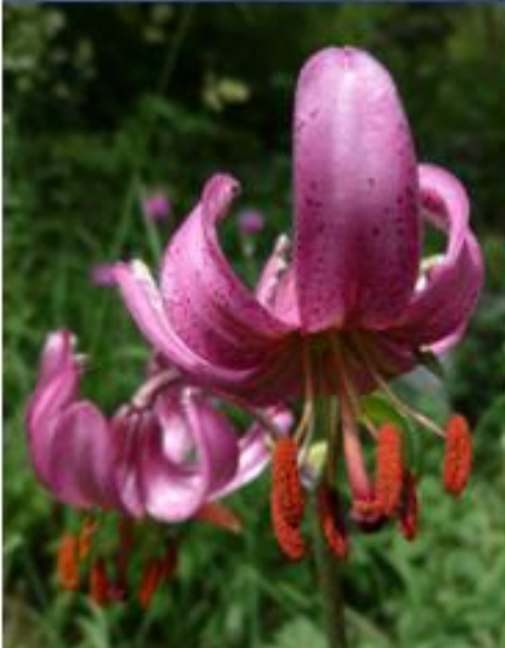
Das langsame Gehtempo ermöglicht uns, die verschiedenen Blumen am Wegesrand zu genießen