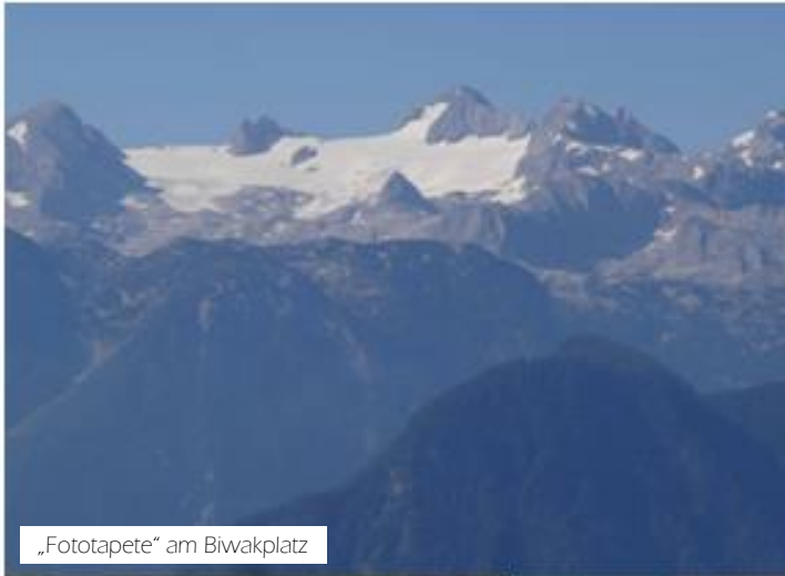
„Fototapete“ am Biwakplatz