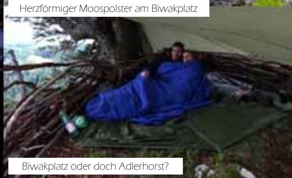
Biwakplatz oder doch Adlerhorst?