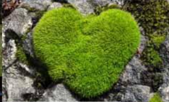
Herzförmiger Moospolster am Biwakplatz