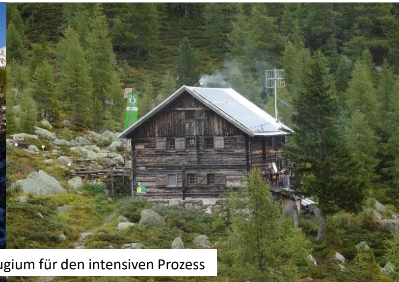
Die Salzkofelhütte – unser Refugium für den intensiven Prozess