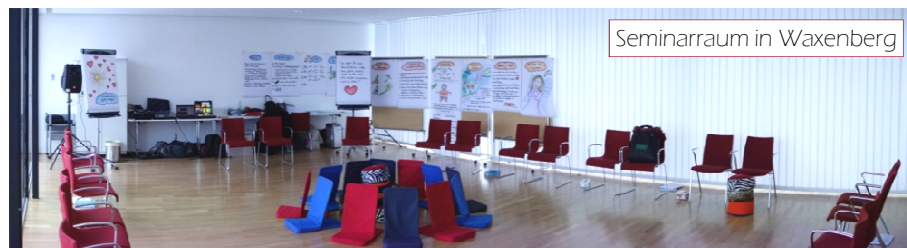
Seminarraum in Waxenberg

Für eine Zimmerreservierung in der Nähe des Tummelplatzes sind die nächstgelegenen Hotels das Hotel Schwarzer Bär, das Hotel Wolfinger und der Mühlviertlerhof. Weitere Möglichkeiten www.tiscover.com/linz oder http://www.linz.at/tourist/hotel_suche.asp oder www.booking.com .